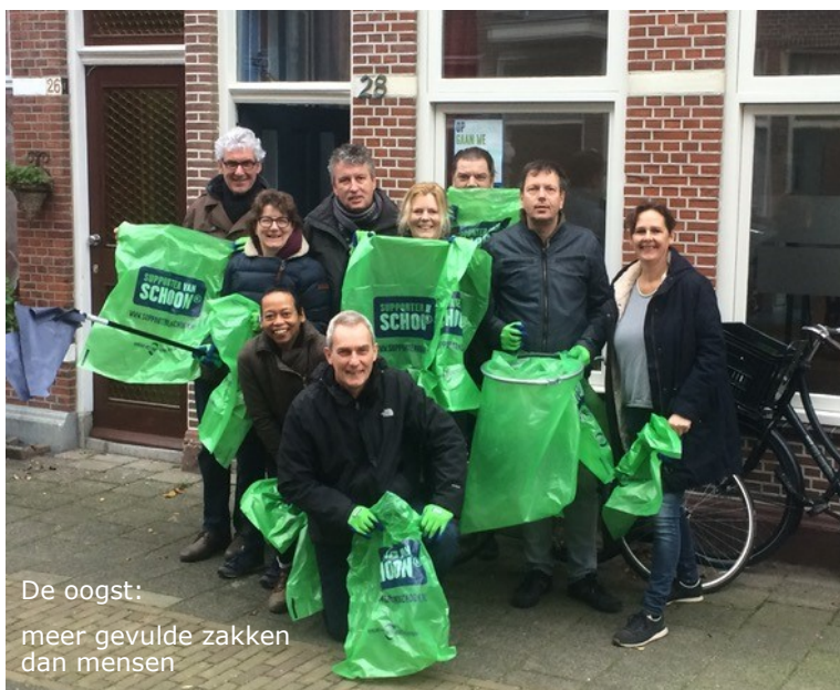
De oogst: meer gevulde zakken dan mensen