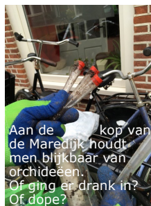
Aan de kop van de Maredijk houdt men blijkbaar van orchideeën. Of ging er drank in? Of dope?