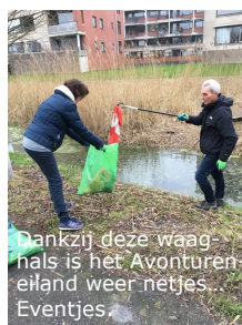
Dankzij deze waag- hals is het Avonturen- eiland weer netjes. Eventjes