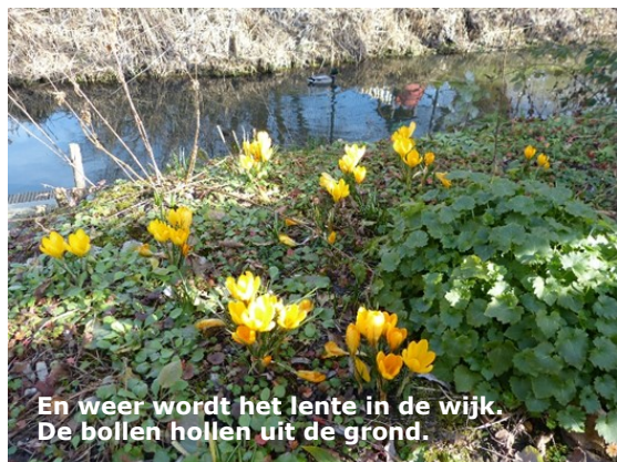
En weer wordt het lente in de wijk. De bollen hollen uit de grond.

Het kost u slechts 5 euro per jaar. Wilt u het formulier in uw brievenbus ontvangen? Belt u dan 071-5139225 of loop langs bij Aloëlaan 41a (secretaris Christa de Boer).